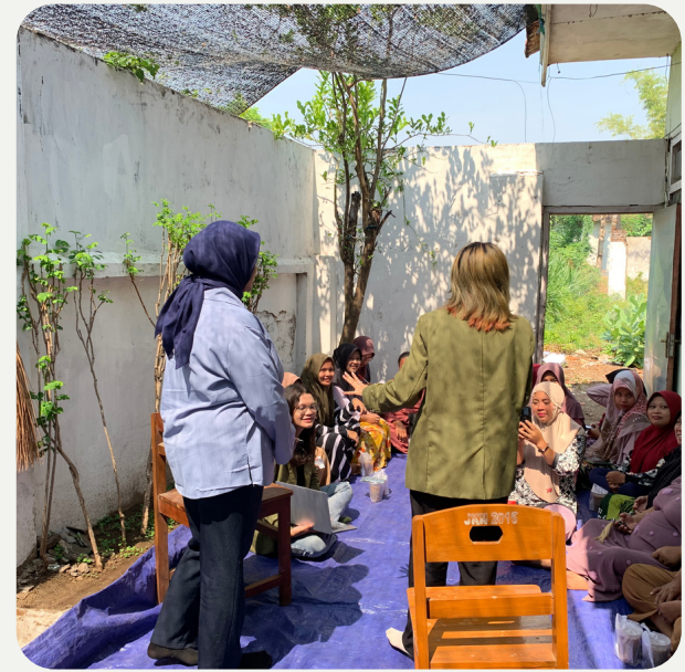
Pembukaan kegiatan sosialisasi oleh MC dan memperkenalkan narasumber kepada ibu-ibu hamil