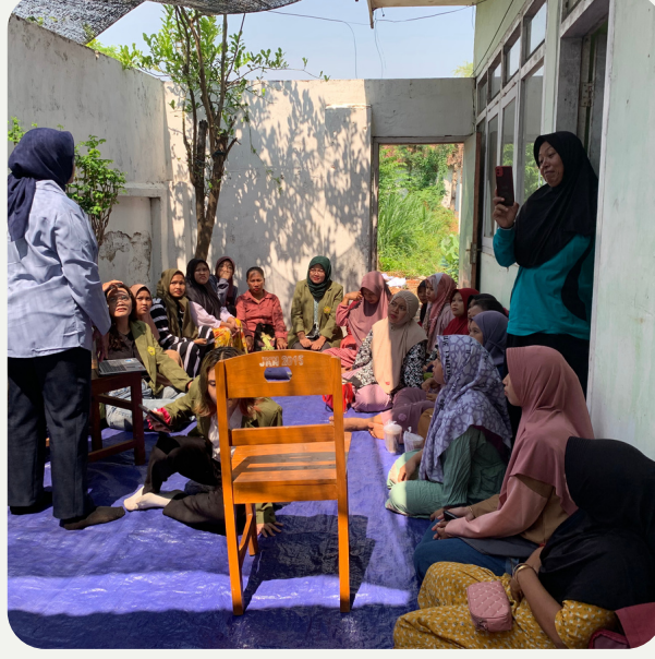
Materi yang disampaikan oleh narasumber disambut antusias oleh ibu-ibu hamil