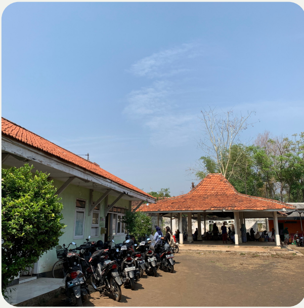
Panitia tiba di Desa Pohsangit Leres, Kab. Probolinggo tepatnya di Posyandu sebagai lokasi project SDGs