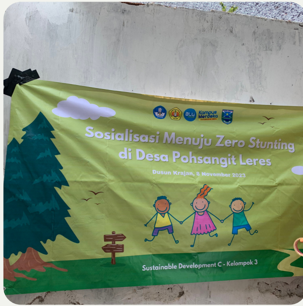
Pemasangan banner sosialisasi di Posyandu oleh panitia