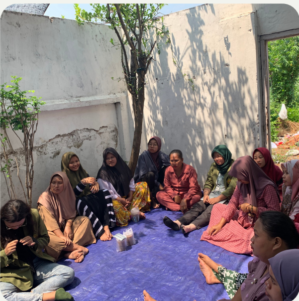
Sebagai bentuk keantusiasan para ibu hamil dalam sosialisasi ini, 5 orang mengajukan pertanyaan kepada narasumber