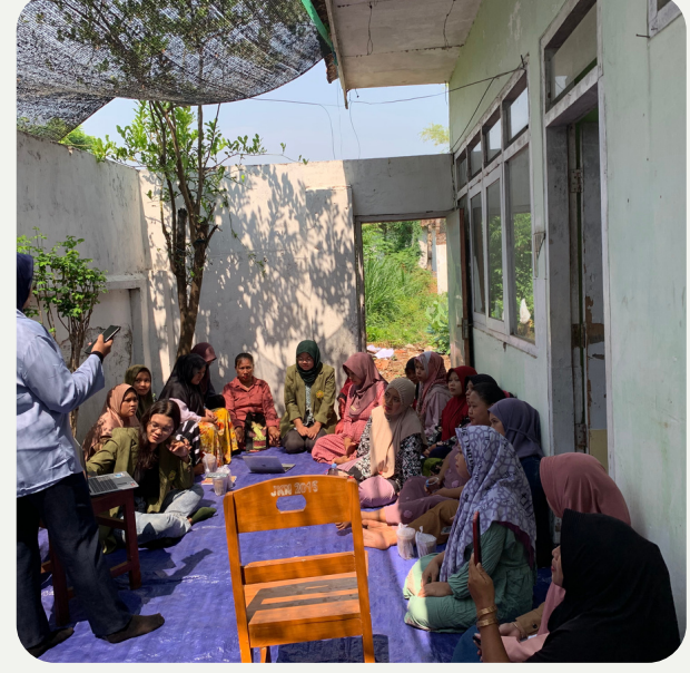
Kegiatan sosialisasi Stunting berhasil dihadiri oleh 22 ibu hamil di Desa Pohsangit Leres, Kab. Probolinggo