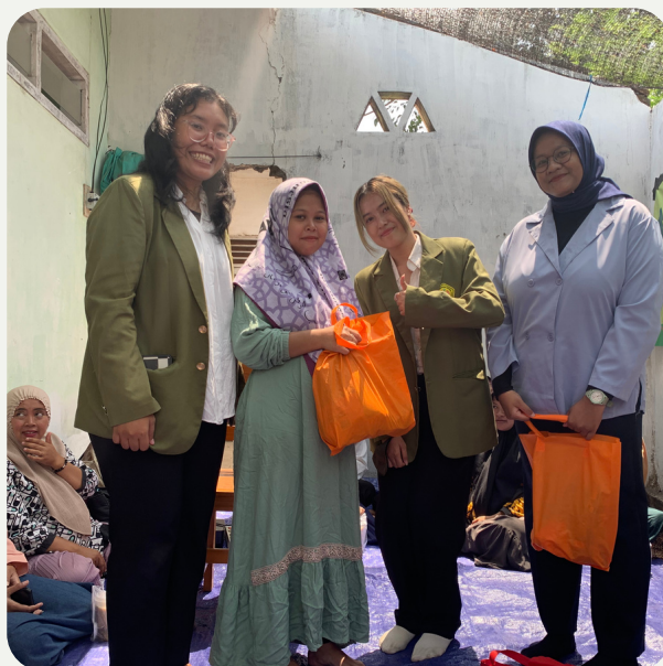
Pembagian hadiah kepada ibu hamil dengan pertanyaan terbaik yang dipilih langsung oleh narasumber