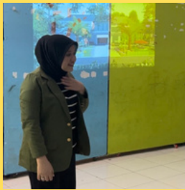
Pembukaan dari pihak panitia