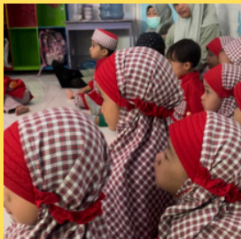
Anak-anak antusias menonton