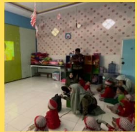
Pemutaran video animasi bahaya food wastage