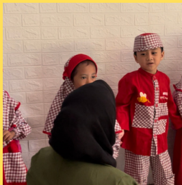
Anak-anak menjawab pertanyaan maksud dari video animasi