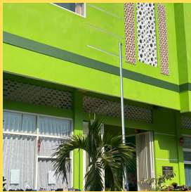
sampai di Pos PAUD Iqro' darussalam