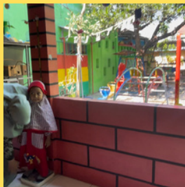
Pengecekan tinggi dan berat badan dari pihak posyandu