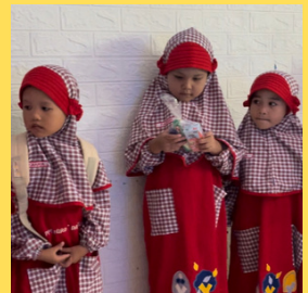
Pembagian Hadiah tambahan bagi anak yang berani menjelaskan isi video